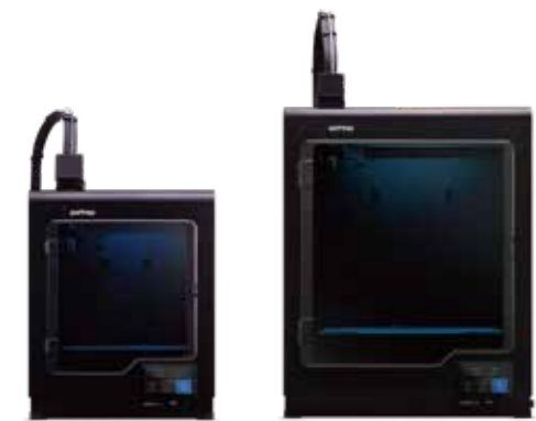
M200 Plus M300 Plus